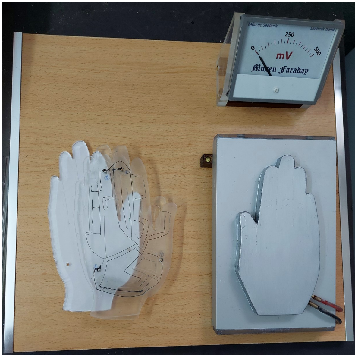
Fig. 5 - Mão de Seebeck e suporte para a experiência mano a mano que incluirá a mão de Ruhmkorff (ainda em construção, situada à esquerda da figura).