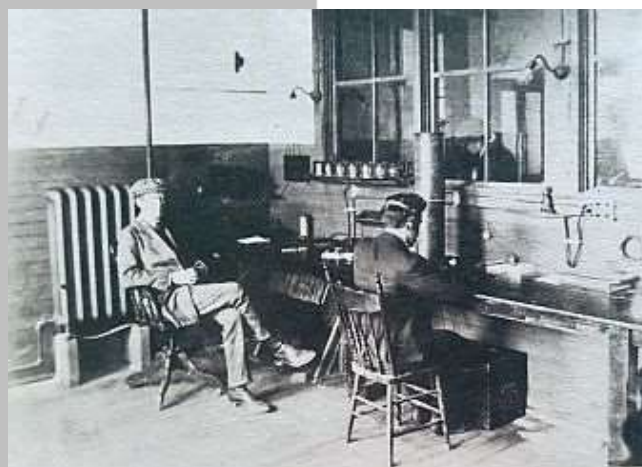
Fig. 3 - Glace Bay, oct. 1907 - Marconi receiving message from Ireland / Marconi a receber mensagem da Irlanda.

In 1902, Marconi established a transatlantic wireless messaging service from Glace Bay in New Scotia (Canada) to Clifden (Ireland), Fig. 3. This service would be made available in 1907.