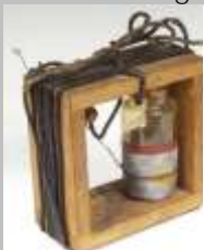
1899 – Marconi - ressonante circuito do 1º emissor / Marconi resonant circuit of 1st emitter.

Marconi began his work in 1896 based on the experience of Righi, his neighbor, and the works of Hertz and Branly. He quickly managed to communicate till distances of a few kilometers transmitting and receiving messages in Morse code.