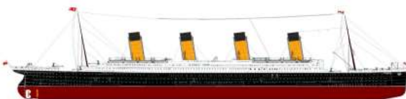
Fig. 6 – Modelo recente do Titanic / Recent model of Titanic.

After the failure to get answers to the successive distress messages, Bride ordered, at 1:15 am, that the SOS distress call (used by all companies except Marconi) be sent. Several ships responded, but it was the RMS Carpathia, which was closer, about 90 km, that first arrived at the Titanic, around 4 a.m. At 2:05 am, the radio telegraphers were relieved of their duties, because Titanic was almost sunk and the wireless telegraphy system no longer worked.