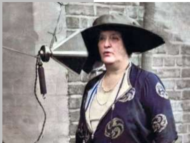
Fig. 9 - Dame Nellie Melba, Chelmsford, GB, Junho 1920. Marconi broadcasts the singer's performance / Marconi fez radiodifusão de atuação da cantora.

On June 20, 1922, at a lecture at American Radio Enginners in New York, in view of the experimental results he had, Marconi predicts the development of RADAR.