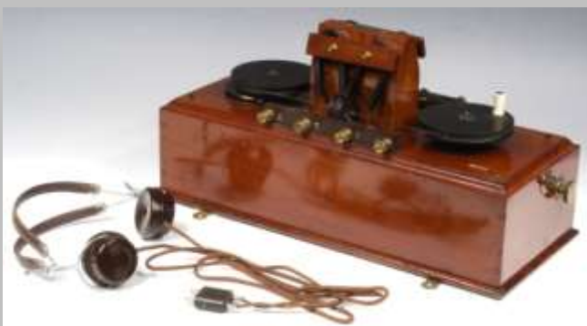
Fig. 2 – Marconi Magnetic Detector "Maggie" [3].

Marconi fez várias viagens transcontinentais no navio Carlo Alberto, um cruzador da marinha italiana fabricado em 1892, mas que em 1902 era usado como iate pelo rei Vitor Emanuel III de Itália.