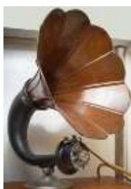
Altifalante Amplion AR-19 (1924) / Loudspeaker Amplion AR-19 (1924) Museu Faraday

Na viagem inaugural (e infelizmente, a última) os bilhetes foram extremamente caros: o preço nas suites Parlow rondava os $400 US dólares ($115000 ao câmbio atual). Era usuais os navios terem os sistemas de TSF desligados durante a noite. Dava-se prioridade à exploração económica do envio de mensagens dos passageiros abastados para familiares em Terra. Pela TSF o comandante do Titanic tinha sido avisado da existência de icebergs à deriva no mar, mas acreditava-se que o Titanic era à "prova de bala".