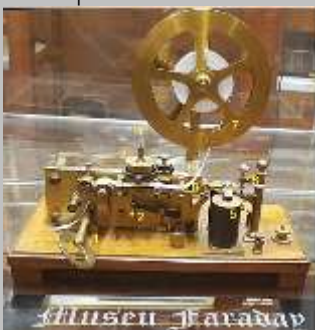
1860 - Impressora de Morse portuguesa / Portuguese Morse Printer.

O mesmo aconteceu com Lee de Forest, que na sua autobiografia se classifica como "Pai da Rádio" , embora tendo também contribuições importantes na Televisão e no Cinema. Alexander Popov é também um dos maiores contribuintes para o desenvolvimento da rádio. Não há portanto um consenso sobre quem inventou a rádio, pois são inúmeras as contribuições feitas por muitos cientistas e inventores.