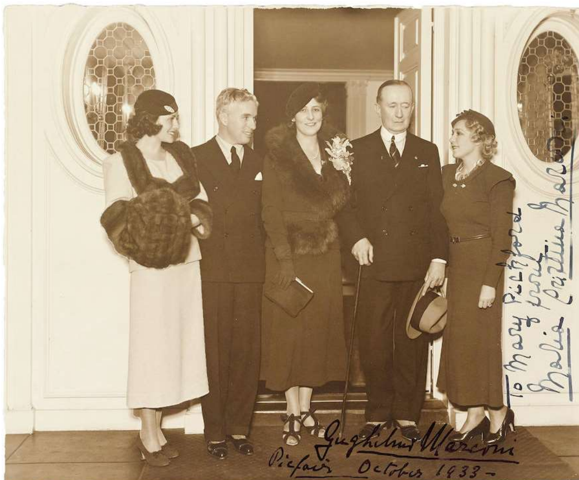
Fig. 13 - Paulette Godard, Charlie Chaplin, Princess Maria Cristina, Marconi e/ and Mary Pickford.