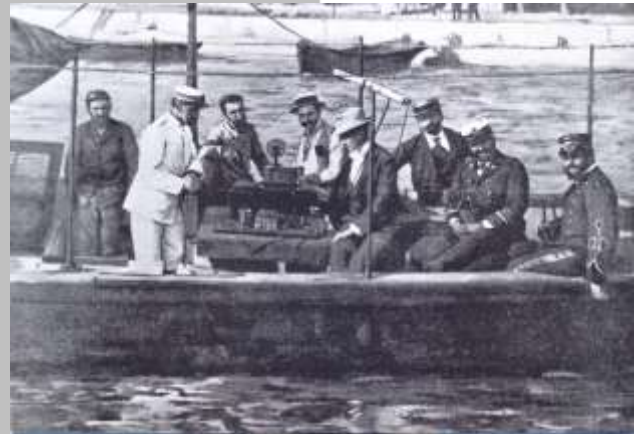
Fig. 1 – Marconi in San Bartolomeu, Spezia. Museu de Marconi. / Marconi em San Bartolomeu, Spezia. Museu de Marconi.

After the experience of transmitting telegraphic signals by radio at about 2.5 km from his home, Marconi had the support of the Italian Royal Navy, which provided in 1897, in San Bartolomeu, Spezia (Italy), for the creation of the first radio station to communicate with ships. This station could communicate in Wireless Telegraphy with ships located less than 20 km away, Fig. 1.