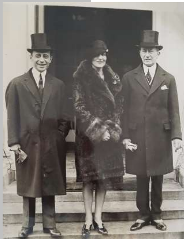
Fig. 12- President Coolidge, princess Maria Cristina and Marconi / Presidente Coolidge, princesa Maria Cristina and Marconi.

Marconi held positions of Italy 'diplomacy. In 1927, as an Italian senator, he was received in USA by President Coolidge to handle business between Italy and USA, Fig. 12.