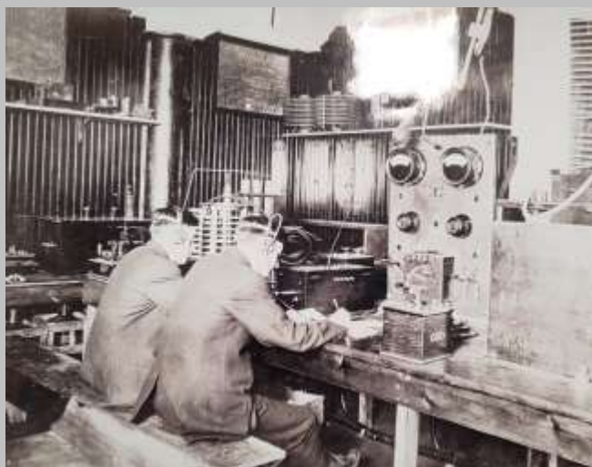
Fig. 7 - Marconi Wireless School (New York, 1912) Operadores a receberem mensagens vindas de navios / Operators copying messages transmitted at sea.

Em 1914, no início da 1ª guerra mundial, Marconi estava no Canadá mas regressou logo a Itália para se inscrever no serviço militar como voluntário e tentar ajudar a melhorar os serviços de comunicações da armada italiana. Foi-lhe atribuído o posto de capitão, mas, em 1916, foi nomeado comandante, tendo prestado vários serviços diplomáticos em representação do governo italiano. De facto, a TSF desempenhou um papel crucial na primeira guerra mundial.