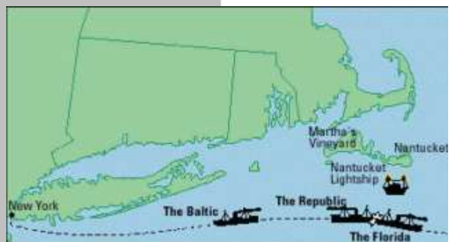
Fig. 5 – Baltic ship going to save lives from the collision / Navio Baltic a caminho de salvar vidas da colisão.

Marconi's success was once again recognized worldwide, when in January 1909 his wireless communication system, which equipped the English ship RMS Republic, saved 1500 lives after the collision of this ship with the Italian ship SS Florida. The Republic issued the first worldwide wireless distress call - the CQD signal - that was received by the White Star's Baltic ship, also equipped with Marconi equipment, which picked up people from both ships, Fig. 5.