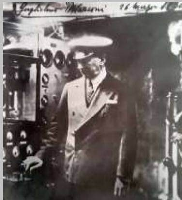
Fig. 10 - Marconi comanda luzes a 14000 milhas de distância / Marconi controls lights from 14000 miles away.

Marconi continuou a explorar este filão das ondas curtas de rádio e em 1931 já estava a trabalhar em ondas ultracurtas (micro-ondas). Em 1932 Marconi fez a primeira ligação telefónica mundial em micro-ondas entre o Vaticano e a residência do papa em Castel Gandolfo, a cerca de 30 km de distância.