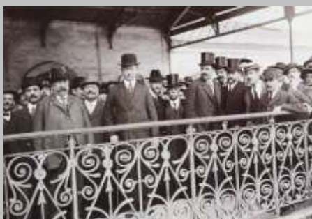
Fig. 11 - 1912- Marconi no Rossio, Lisboa / Marconi in Rossio, Lisboa.

Marconi esteve em Portugal por cinco vezes: uma, em 1902, num navio, embora não tenha desembarcado; as restantes foram em 1912, 1920, 1922 e 1929, em que teve conversações com entidades portuguesas, Fig. 11.