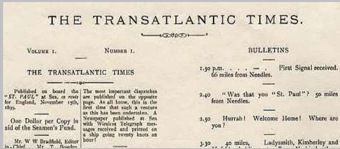
Fig. 4 – Transatlantic Times - primeiro jornal a bordo / First newspaper on board.

Os russos consideravam Alexander Popov o seu cientista mais experiente na TSF, mas este não conseguiu em tempo útil dotar as forças russas com os equipamentos desejados, pelo que os russos requisitaram o apoio dos alemães, que lhes forneceram equipamentos Telefunken.