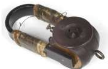
Auscultador usado por Marconi em Newfoundland, 1901, na primeira comunicação transatlântica / Headphone used by Marconi in Newfoundland , 1901, to receive first transatlantic communication.

No cinema, o drama do naufrágio do Titanic foi explorado já por 19 filmes. O mais conhecido, o filme Titanic, foi realizado em 1997 por James Cameron.