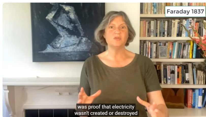
Faraday Cage: History and Importance

Uma das experiências de Nikola Tesla com transformadores ressonantes geradores de alta frequência e alta tensão.